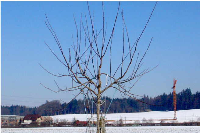
Junger Hochstammbaum vor dem Schnitt

Die Mitte sollte ebenfalls auf gleiche Höhe bis ungefähr eine Handbreit höher angeschnitten werden. Lässt man sie zu hoch, wird sie gegenüber den Leitästen zu dominant.