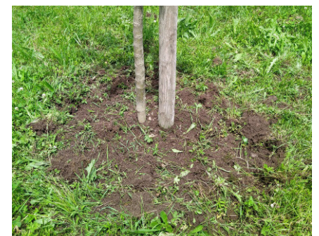
Das Hacken der Baumscheiben ist eine wichtige Massnahme um Wühlmäuse fernzuhalten.

In den folgenden ersten Jahren sollte die Baumscheibe frei von Bewuchs gehalten werden. Dies ist eine der wichtigsten Massnahmen, um Schäden durch die Wühlmaus zu verhindern sowie Wasser- und Nährstoffkonkurrenz durch das Gras zu minimieren. Zudem ist regelmässig zu prüfen, ob der Baum noch gut an den Pfahl angebunden ist, ohne dass der Strick in den Stamm einschneidet.