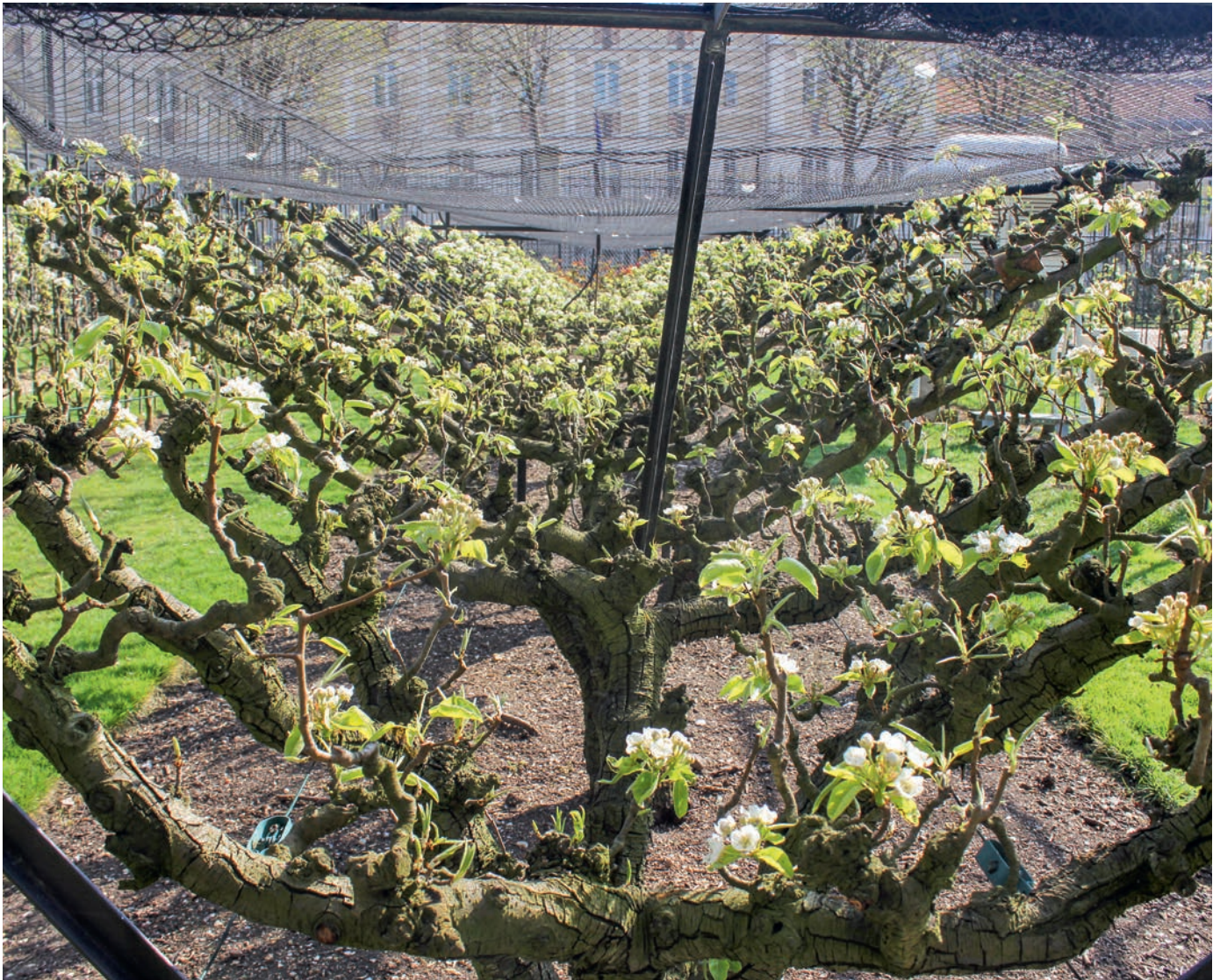
Agés d'une quarantaine d'années, ces poiriers Comice en «livre ouvert» sont cultivés au Jardin du Luxembourg, à Paris. Il faut au minimum une dizaine d'années pour obtenir la forme aboutie.