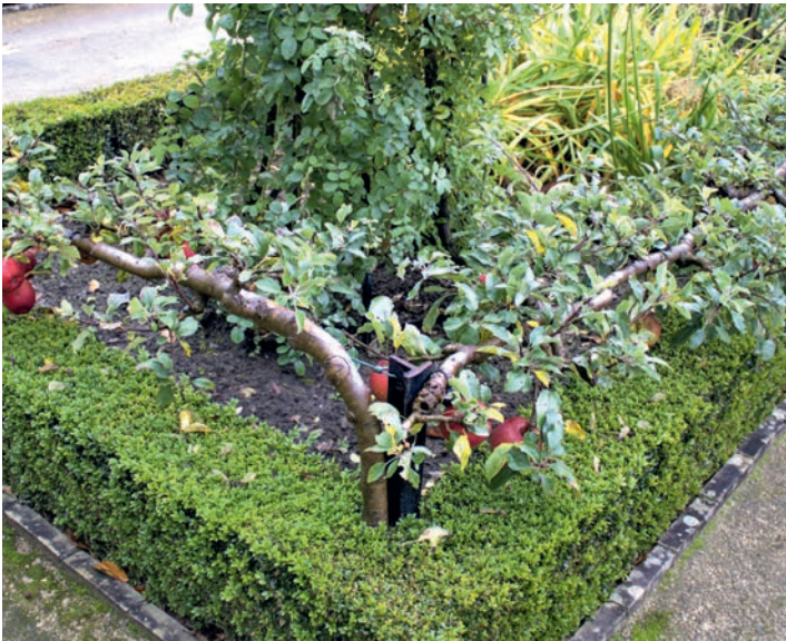
Cours de taille pour les futurs formateurs (en haut). En bas, un magnifique pommier de 30 ans en cordon horizontal bilatéral et à droite, un poirier en forme dite palmette Verrier, également de 30 ans, tous deux à contempler dans le jardin-musée de Gaasbeek.

Louis XIV, le potager est géré par l'École nationale de paysage (ENSP) de Versailles et constituée à ce jour la plus grande collection de formes fruitières du monde.