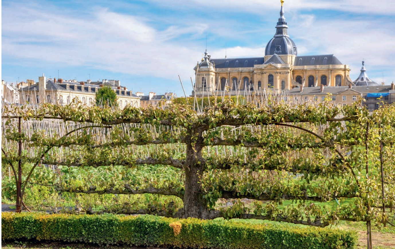
Poirer taillé en palmette horizontale à cinq étages dans le Potager du Roi, à Versailles, sous la protection de la cathédrale St-Louis.